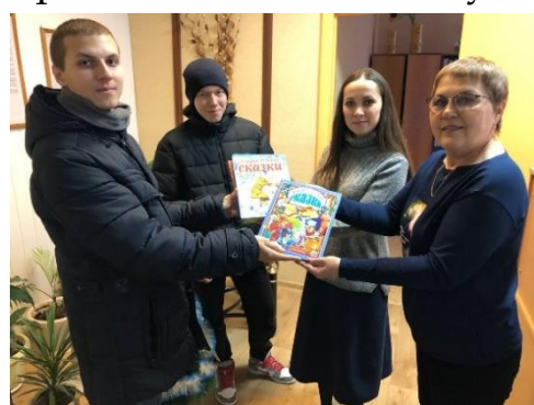
Книги для детей от студентов и преподавателей ИГРТ.

12 декабря студенты лично отвезли книги в филиал Центра социального обслуживания. По пути посетив Детскую социальную поликлинику, куда была передана часть детской литературы.