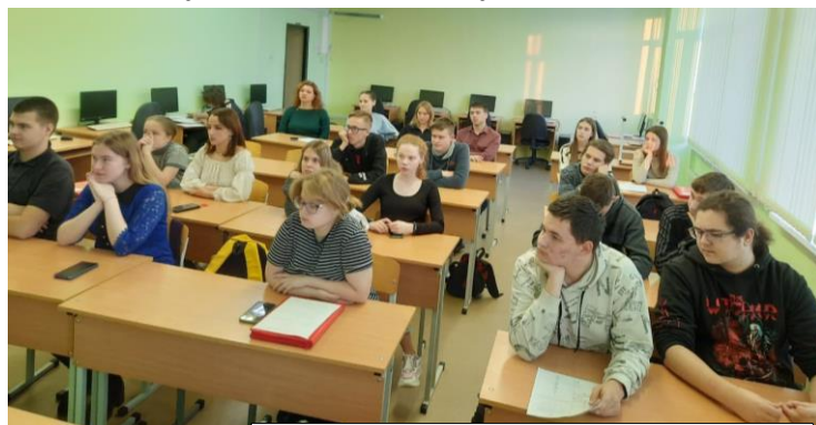
Очередное заседание студенческого совета ИГРТ