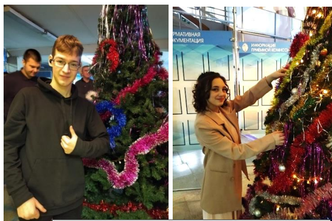
К встрече Нового года готовы!

Активисты Студенческого совета периодически ещё с 2007 года были организаторами участковой избирательной комиссии на базе техникума по выборам в Молодёжный парламент Свердловской области. Ребята проходили обучение в Территориальной избирательной комиссии г. Нижняя Тура, в дни выборов работали в комиссии, подсчитывали голоса, заполняли итоговые протоколы и передавали результаты в